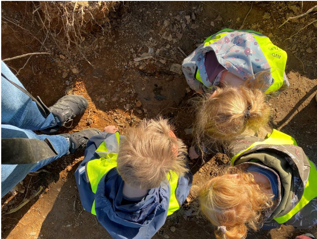
Nysgjerrige barn lærer best